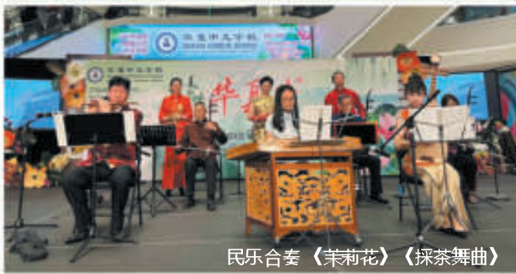
民乐合奏《茉莉花》《采茶舞曲》