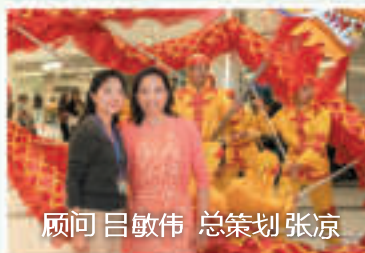
顾问 吕敏伟 总策划 张凉