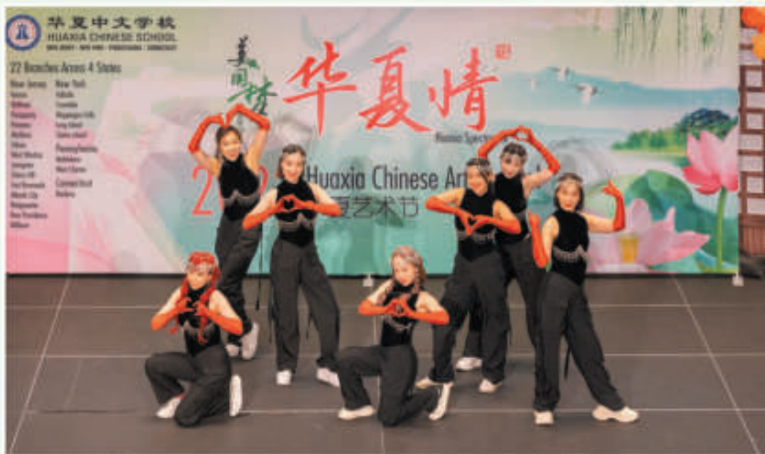
K-pop 韩国流行舞《Girls in the Morning》

史颖舞蹈学校FA Dance 授课老师均是国内外专业顶级院校毕业，并依然活跃在中美舞台的一线演员和教师。我们通过中国舞蹈窗口，向海外的朋友们介绍中国的文化，特别是为美国的华人朋友和生长在美国的华人孩子们创造机会和环境。同时我们也有芭蕾、现代舞、韩流、嘻哈舞全舞种课程。