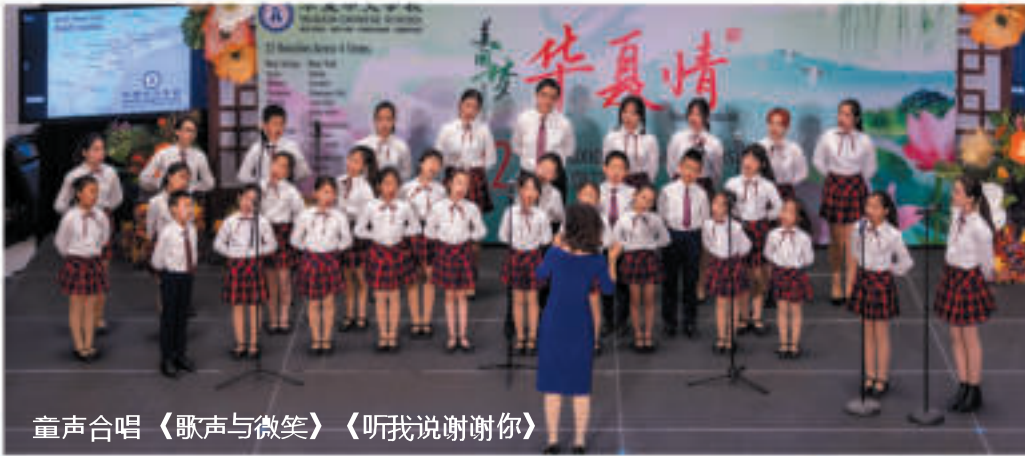
童声合唱《歌声与微笑》《听我说谢谢你》