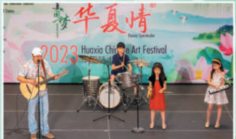
原创吉他弹唱《摇椅》