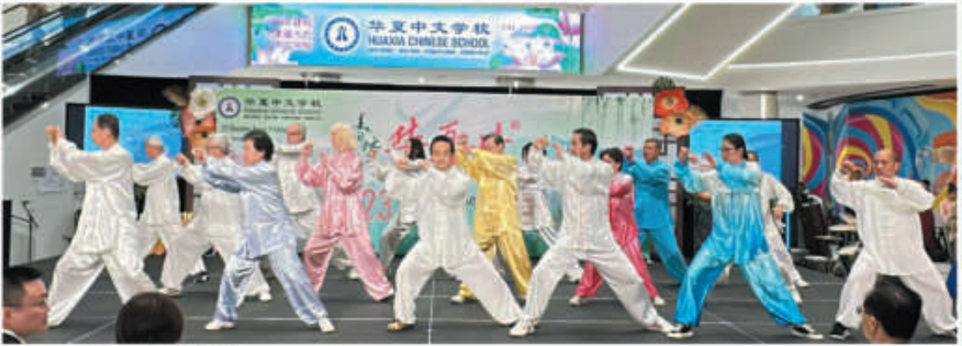
功夫《和式太极拳》- Cheung's Martial Arts Academy

学校开设中文课程和以中国文化为主的文体课程。学校在周六下午1:30-4:20 上课 两节中文课 一节文体课。招收年满四周岁以上的儿童及成人。中文课程教授汉语拼音和简体中文，设有学前班，拼音班，九年级共十一个年级。我校还开设汉语为非母语的中文班（儿童和成人）。此外，学校还设有中文AP/ HSK班。文化课包括击剑、中国书法国画、少儿绘画、课外阅读班、拉丁舞、民族舞、健身塑型、瑜伽、武术、太极、小提琴、钢琴、吉他、戏曲演唱和服饰、摄影、卡拉OK，TA课Robotics、Python编程、数字艺术、棋类、YoYo、数学俱乐部、少儿阅读、辩论训练班等。