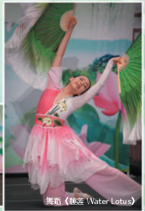
舞蹈《睡莲 Water Lotus》