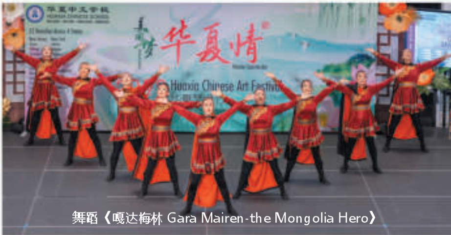
舞蹈《嘎达梅林 Gara Mairen-the Mongolia Hero》