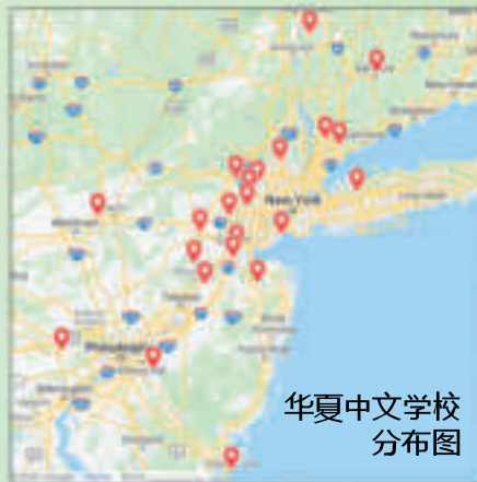
华夏中文学校 分布图

华夏中文学校创建于1995年2月，作为当时新州唯一教授汉语拼音和简化字的学校，她的建立引起华人社区广泛深远的响应和热情的支持参与，学校如雨后春笋般成长壮大，由刚开始的七十多位学生增加为目前的七千多名，二十二所分校遍及新州、纽约州、宾州和康州。今天的华夏中文学校已成为全美最大和最有影响力的品牌中文学校。