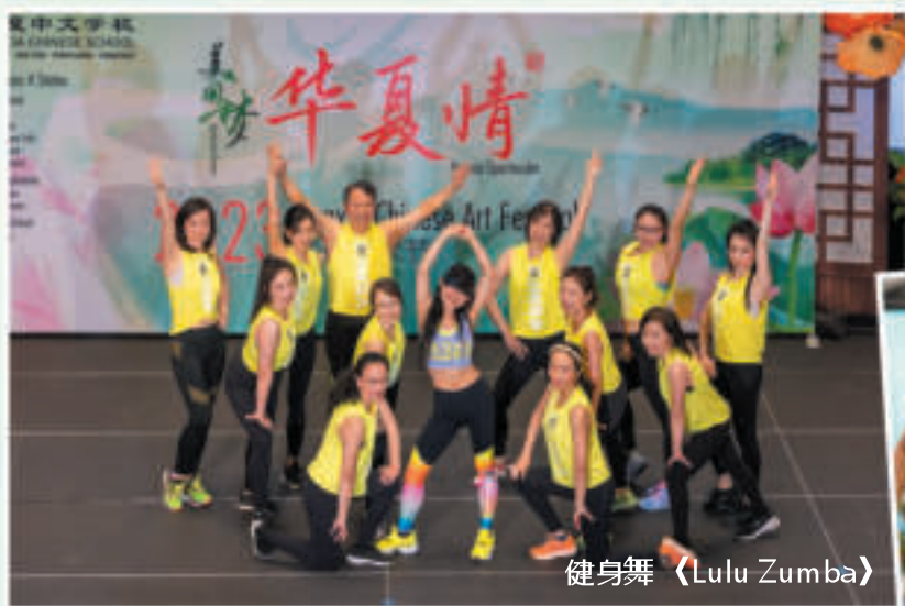
健身舞 (Lulu Zumba)

密尔本华夏中文学校每周日上午9点至12点半上课, 招收从学前班到九年级的学生。除中文课程以外, 我们优秀的师资队伍还将提供多种文体课程和CSL课程。教学之余, 家长会和学校其他管理部门将组织各种学生和家长活动, 拓展师生的社交网络。欢迎广大学生和家加入我们, 一起为培养植根中西文化的下一代、传承华夏文明作出贡献。