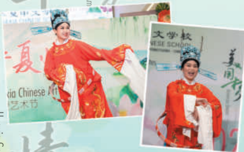
黄梅戏《谁料皇榜中状元》

As one of the five major traditional operas in China, Huangmei Opera is famous for its sweet melodies and lyrics, graceful sounds and movements, and beautiful costumes and sets. Huangmei fans can be found not only on the Chinese mainland but also in Hong Kong, Macao, Taiwan, Malaysia, Japan, and even Europe. The Opera Club from Edison Huaxia Chinese School strives in every way to provide a platform for opera amateurs to learn and enjoy traditional Chinese operas. They performed the classic Huangmei Opera "Nv Fu Ma" aria: "Shui Liao Huang Bang Zhong Zhuang Yuan".