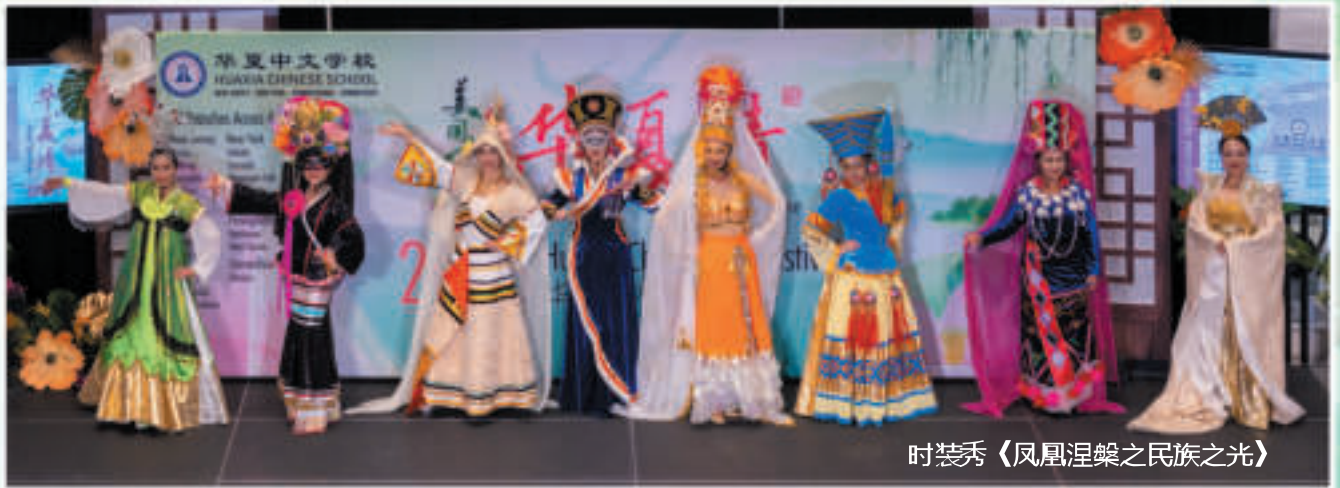
时装秀《凤凰涅槃之民族之光》

"Miao Sisters" is a Miao ethnic dance. This dance depicts a joyful scene in spring where a group of young girls play and frolic in the grass, engaging in fist-fighting competitions.