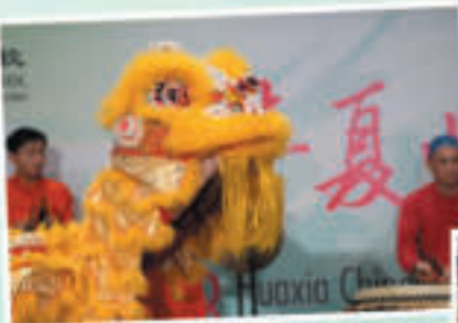
长岛慈济人文学校舞狮队 Tzu Chi Academy Long Island Lion Dance Team