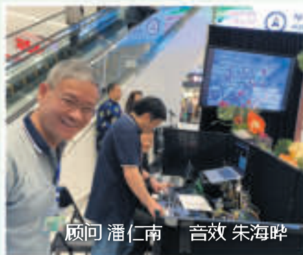
顾问 潘仁南 音效 朱海晔