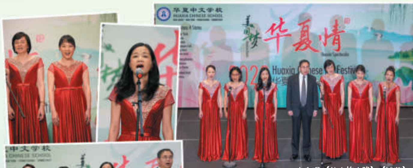
小合唱《故乡的小路》《绒花》

华夏普兰斯堡中文学校位于美国新泽西中部西温莎-MCCC，在星期天下午上课。作为华夏中文学校的成员，学校为全体会员拥有的独立法人，是一个非营利、无宗教色彩、政治中立的文化教育组织。学校以中文和中国文化教育为主要目的，并积极参与社区文化交流。中文教学的主体为K - 9年级系统性的简体中文教育，另有中文提高班和双语班。学校还开设丰富多彩的文化体育课程，包括武术、太极、击剑、体操、羽毛球、排球、围棋、象棋、数学、民乐、绘画、手工等。学年从每年九月开始，至次年六月结束。