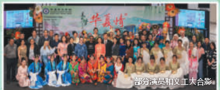
部分演员和义工大合影