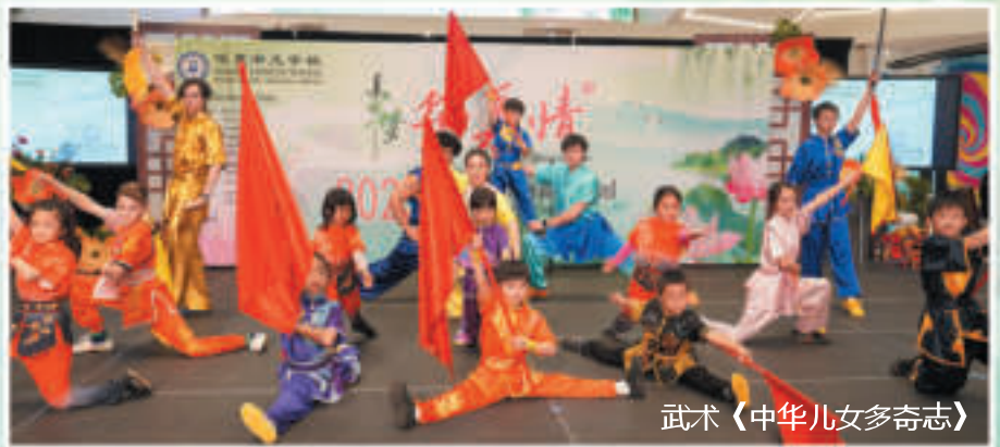
武术《中华儿女多奇志》

中国武术，也被称为功夫，拥有4000年的历史，包括许多经过几个世纪发展起来的格斗风格，是中国文化的重要组成部分。如今，武术是一项非常流行的国际运动，也广泛用于健身、表演和自卫。武术功夫健身中心的教练和学生表演来自长拳和南拳功夫风格的手形和武器套路。